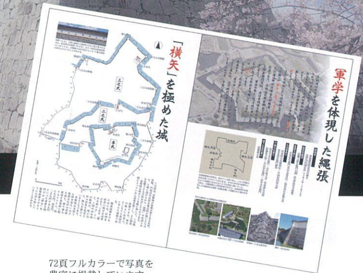
72頁フルカラーで写真を豊富に掲載しています。

赤穂市が公開している郷土資料は、播磨全域にわたる石碑の拓本を作成し『歴史と文化の跡を訪ねた