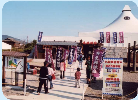
大河ドラマ元禄縁乱館 (H11)

大河ドラマの誘致は赤穂市活性化の起爆剤となる。昨年の質問で豆田市長は、忠臣蔵サミットの枠組みでの活動について言及された。首長自らが先頭に立つことや担当部署の必要性についても触れられた。前回の東京オリンピック時の大河ドラマは「赤穂浪士」だった。明石市長はどのように誘致活動を展開して行くのか。