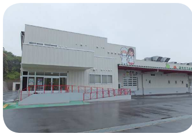
袋井市給食センター