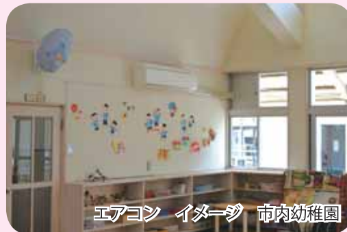
エアコン イメージ 市内幼稚園