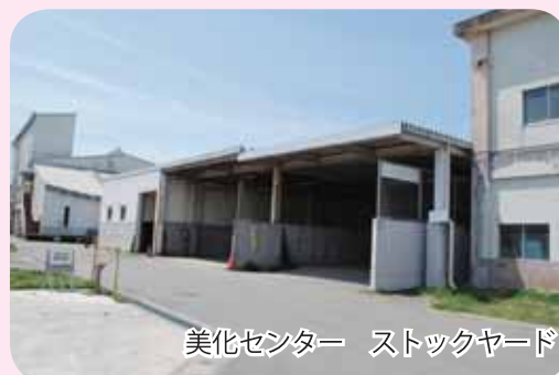
美化センター ストックヤード