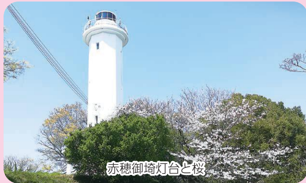
赤穂御埼灯台と桜