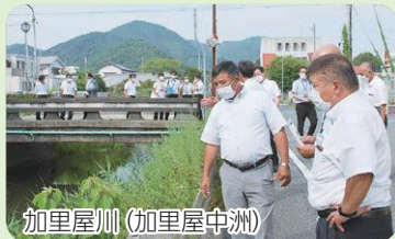
加里屋川(加里屋中洲)

令和4年度は、8月23日に委員会を開催しました。委員会では、幹線道路、河川及び砂防河川の整備状況について当局より報告を受けました。その後委員から、市内幹線道路等の整備状況について、また高取峠のトンネル化及び交通事故防止対策等について質疑を行った後、本年度の取り組みについて協議し、県などの関係機関に対し要望活動を行うことが必要であるとししました。委員会終了後、国道250号高取峠及び河川の整備状況について、現地の視察を行いました。