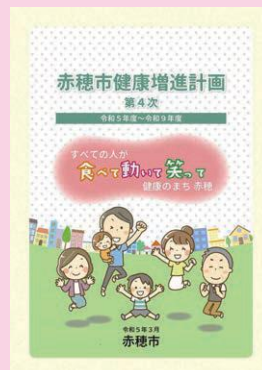
第4次 赤穂市健康増進計画