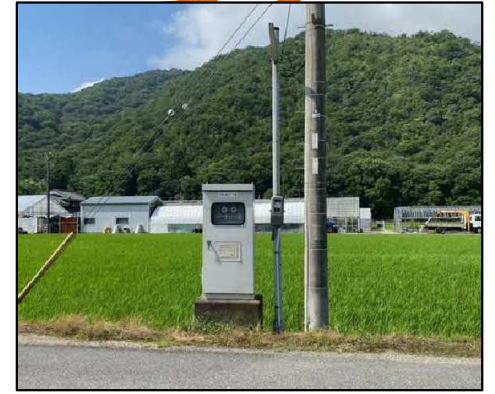
【マンホールポンプ場】