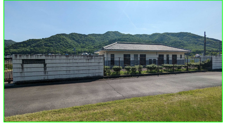
【西有年第2農業集落排水処理施設】