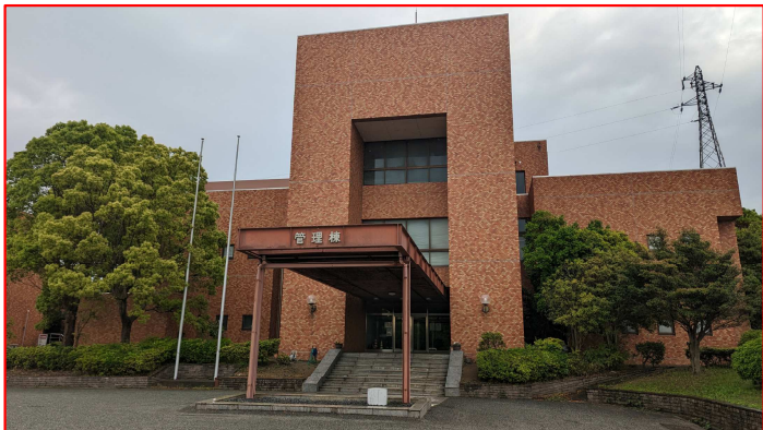
【赤穂下水管理センター】