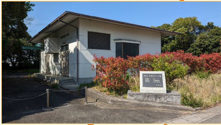
【磯浜中継ポンプ場】