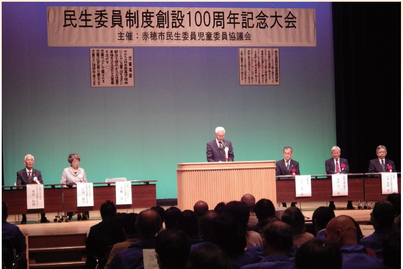
10月20日 民生委員制度創設100周年記念大会 於：赤穂市文化会館