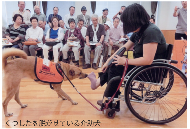
くつしたを脱がせている介助犬

そんな時は、言う側言われる側のどちらも心が傷ついています。双方が冷静になるのを待って、親のプライドを捨て、小さい子はぎゅっと抱きしめて「ゴメンね」と謝りましょう。そして、何があっても「あなたを愛してる」「あなたを信じてる」と伝えましょう。