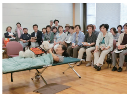
目覚ましの音を知らせる聴導犬

読み情けなくなりました。障がいのあるユーザーの身体の一部として活動できるように私たちも一層の理解と支援をしていきたいと思っています。