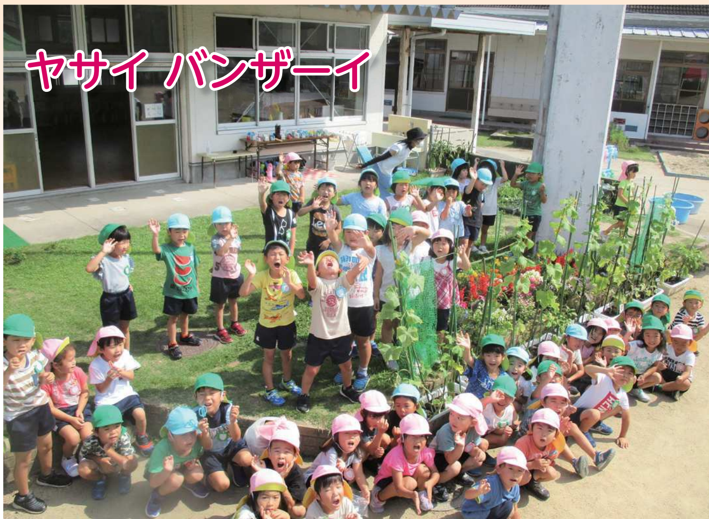
坂越幼稚園の園児達