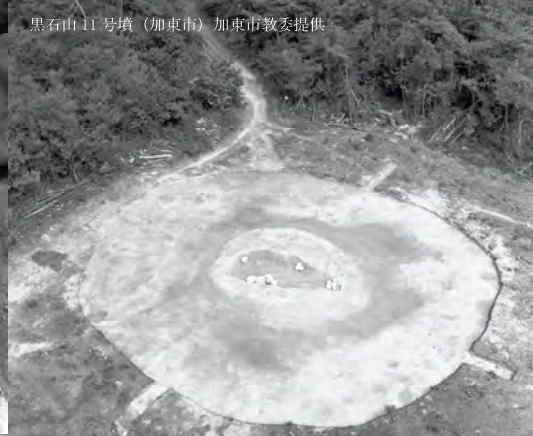
黒石山11号墳 (加東市) 加東市教委提供