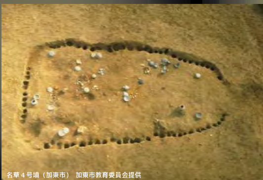
名草4号墳（加東市）