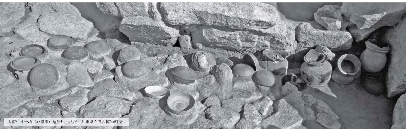
太市中4号墳 (姫路市) 遺物出土状況

今回の展示では、個性豊かな播磨地域の「群集墳」から、当時の社会・死生観とその変化を考えます。