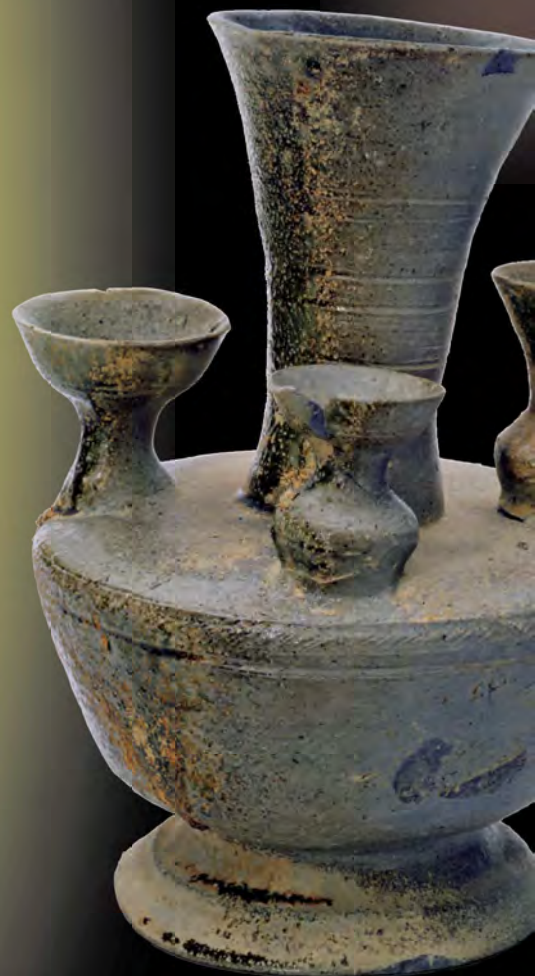
西脇79号墳（姫路市） 出土装飾須恵器（兵庫県立考古博物館蔵）