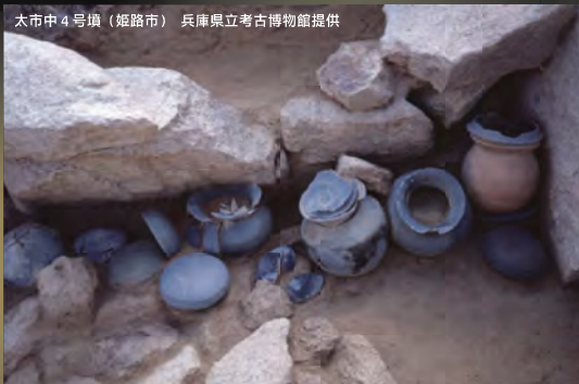
太市中4号墳（姫路市）