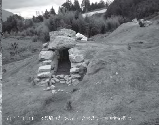
龍子向イ山1・2号墳 (たつの市)