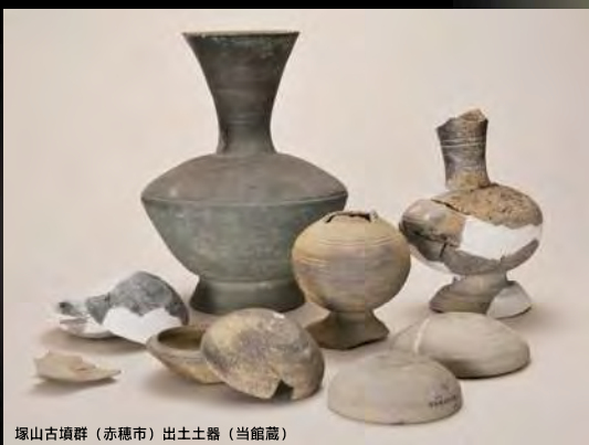
塚山古墳群（赤穂市）出土土器（当館蔵）