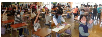
1年生 もうすっかり小学生