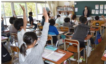
6年生 外国語 ペラペラ