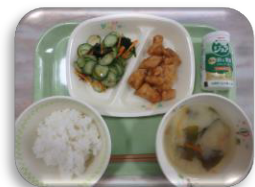
今週のメニュー毎日最高!