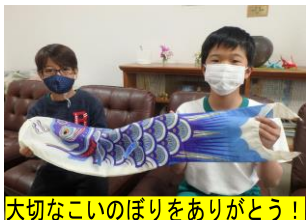
大切なこいのぼりをありがとう!