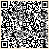
応募受付フォーム

https://www.e-hyogo.elg-front.jp/hyogo/uketsuke/form.do?id=1685510517466