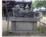
濱の宮天満宮の神牛

日本海や瀬戸内海沿岸には、山を風景の一部に取り込む港町が点々とみられます。そこには、港に通じる小路が随所に走り、通りには広大な商家や豪壮な船主屋敷が建っています。また、社寺には奉納された船の絵馬や模型が残り、京など遠方に起源がある祭礼が行われ、節回しの似た民謡が唄われています。これらの港町は、荒波を越え、動く総合商社として巨万の富を生み、各地に繁栄をもたらした北前船の寄港地・船主集落で、時を重ねて彩られた異空間として今も人々を惹きつけてやみません。