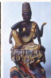
えんどうは、あつしに「いりんかんせおんぼさつ 圓教寺と六臂如意輪観世音菩薩