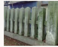
九所御霊天神社の玉垣