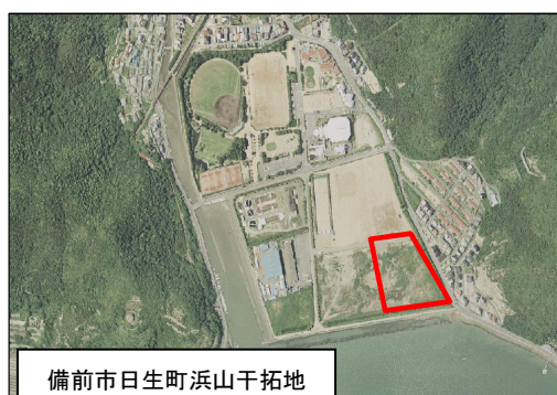
備前市日生町浜山干拓地