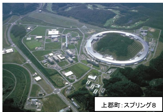
上郡町:スプリング8