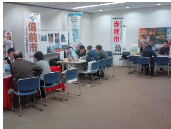
3市町による定住相談会