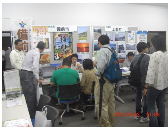
ふるさと回帰フェアへの出展