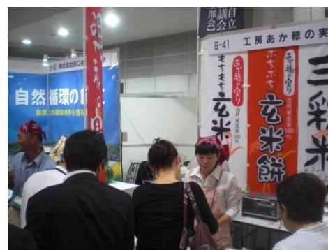
『アグリフードEXPO 東京 出展』 (東京ビッグサイト)