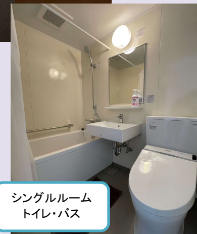
シングルルーム トイレ・バス