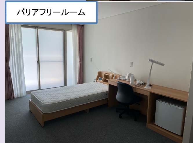
バリアフリールーム