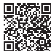
子育て学習 センターHP QRコード