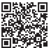
うね・のり愛号HP QRコード

〒678-0292(住所不要)企画政策課 ☎43・6867 FAX43・6822