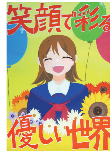
ポスターの部 最優秀作品