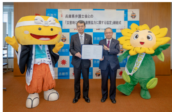
市長と兵庫県弁護士会会長との間で、協定書を取り交わしました。(10/21 市役所)