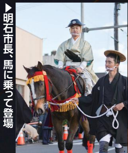
▶明石市長、馬に乗って登場