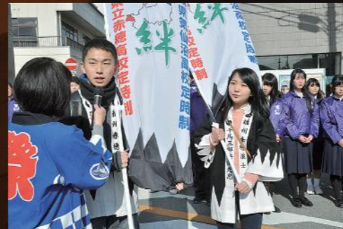
▲気仙沼高校から参加! 赤穂高生と絆パレード