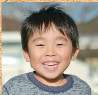
もうすぐ3歳のお兄ちゃん、楽しみだね