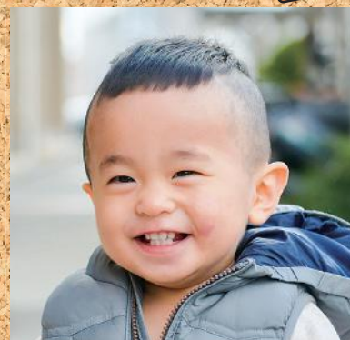
お父さんみたいになっちゃ!!