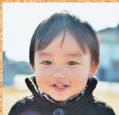
きょうだい仲良くあそぼうね