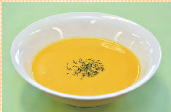
(料理協力: 赤穂市いずみ会)