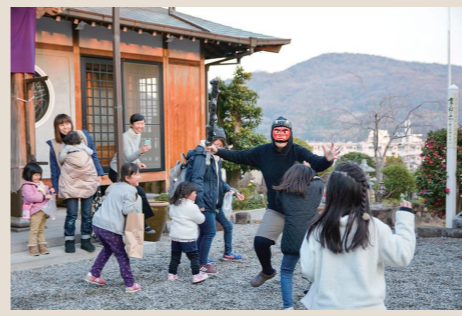
普門寺の境内に、鬼が出たよ～！「鬼は外！福は内！」殻付落花生は回収してやつに！