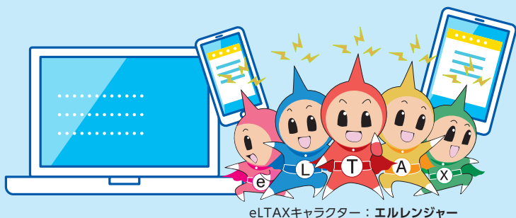
eLTAXキャラクター：エルレンジャー