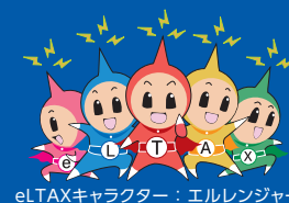
eLTAXキャラクター：エルレンジャー